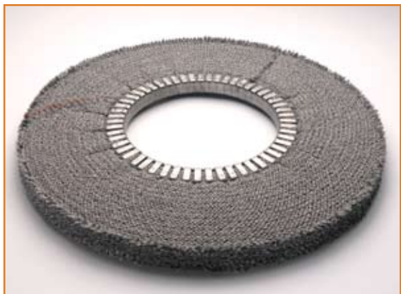
art. 1153 AS con impregnazione GRIGIA