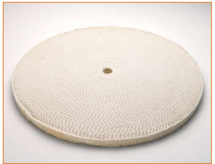
art. 1157 sisal + cotone