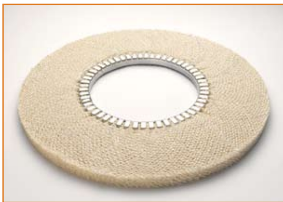
art. 1153 NS