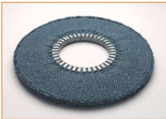
art. 1153 NS con impregnazione BLU