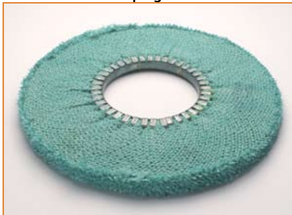
art. 1153 NS con impregnazione VERDE