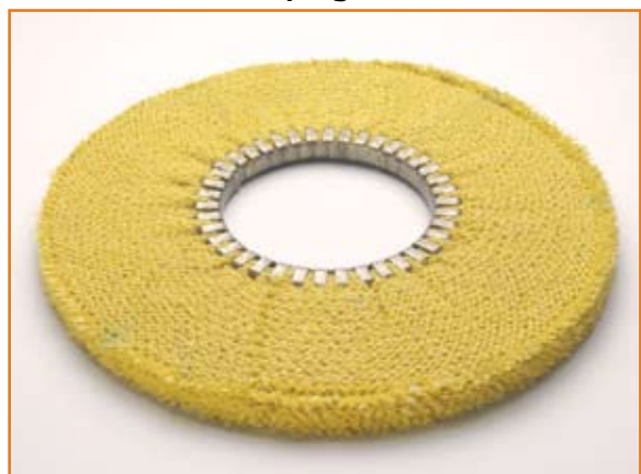
art. 1153 NS con impregnazione GIALLA