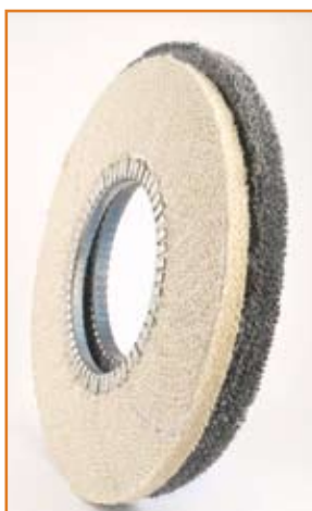
art. 1153 NS e AS