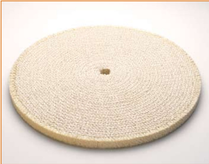
art. 1166 solo sisal