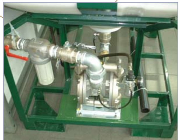
Montaggio di Pompa e Filtro sul Siletto