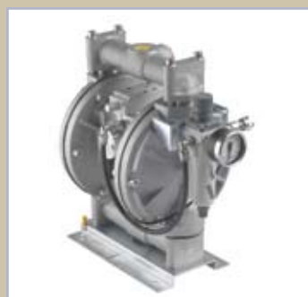
Pompa PM/500 - SP